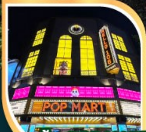
ร้านPOP MART ที่ใหญ่ที่สุดในไต้หวัน