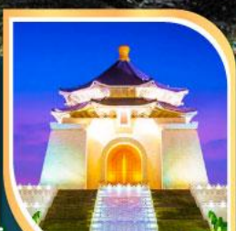
เจียงโกเชิก