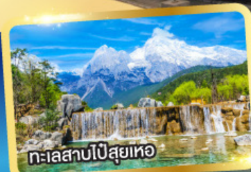
ทะเลสาบไป๋สฺยฺเหอ