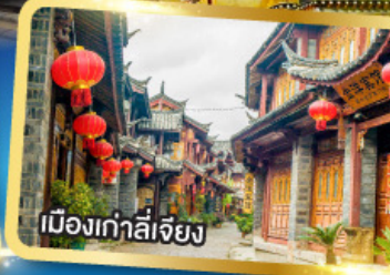
เมืองเกาลี่เจียง