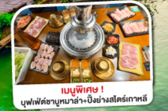
เมนูพิเศษ! บุฟเฟ่ต์ชาบูหม่าล่า+บิงย่างสไตล์เกาหลี