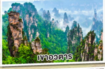
เหวอวตาร