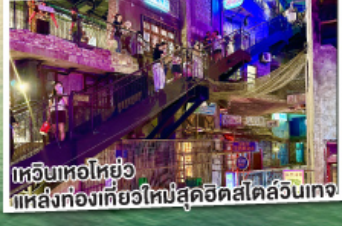
เทวีนหอโฮยอ แหล่งท่องเที่ยวใหม่สุดฮิตสไตล์ลอนเทจ