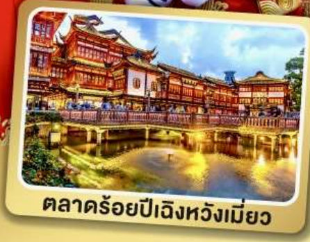
ตลาดร้อยปีเฉิงหวังเหมียว