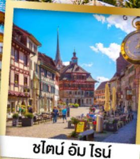
ชไตน์ อัม โรน์