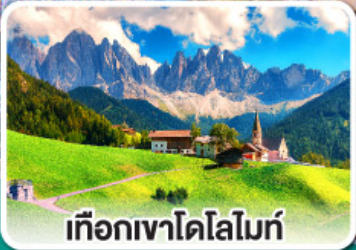
เทือกเขาโดโลไมท์