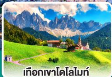
เทือกเขาโดโลไมท์