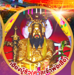
เมืองบูชิว (ศาลเจ้าพ่อเสื่อ)

เมนูพิเศษ!! อาหารแต่จิว 18 อย่าง ห้ามพลาด! ไม้ต้นตำรับชิวเกา สุกี้ซิว