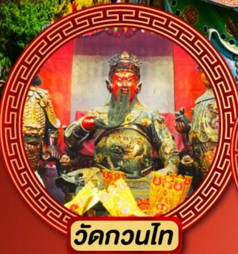
วัดกวนไท