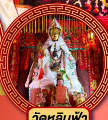
วัดหลินฟ้า