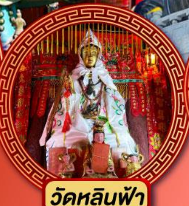
วัดหลินฟ้า