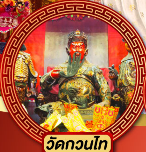
วัดกวนไท