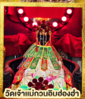
วัดเจ้าแม่กวนอิมฮ่องฮ่า