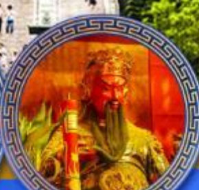
วัดกวนโถ