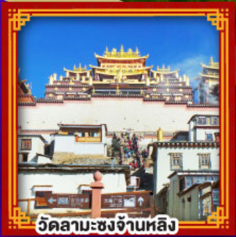
วัดลามะซงจ้านหลิ่ง