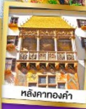
หลังคาทองคำ