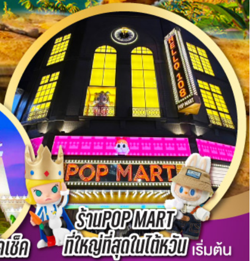
ร้าน POP MART ที่ใหญ่ที่สุดในไต้หวัน เริ่มต้น

เมนูพิเศษ!! ชาบู บุฟเฟ่ต์ ปลาประมานาริบคิ, เสียวหลงเปา