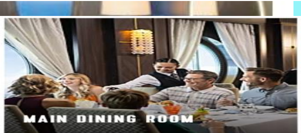
MAIN DINING ROOM