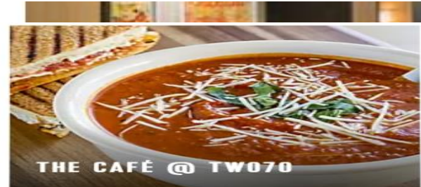
THE CAFÉ @ TW070