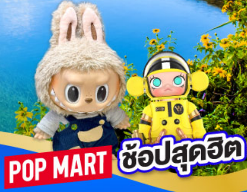
POP MART ซ้อปสุดฮิต