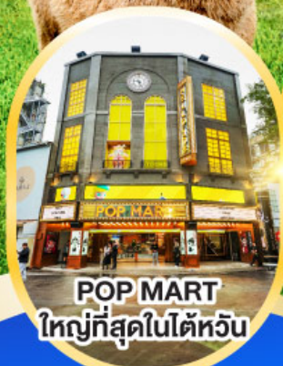
POP MART ใหญ่ที่สุดในไต้หวัน