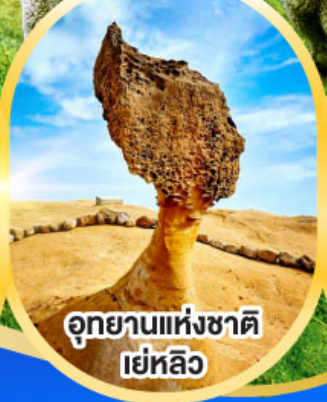
อุทยานแห่งชาติ เย่หลิว