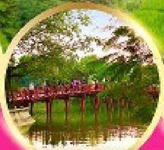
ทะเลสาบคินคาน