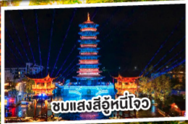
ชมแสงสีอุ้หนี่ใจ