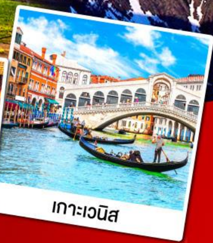
เกาะเวนิส