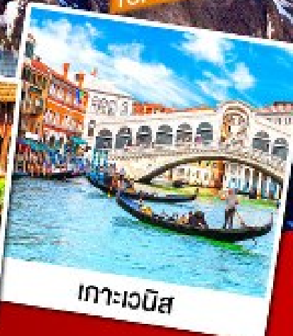
เกาะเวนิส