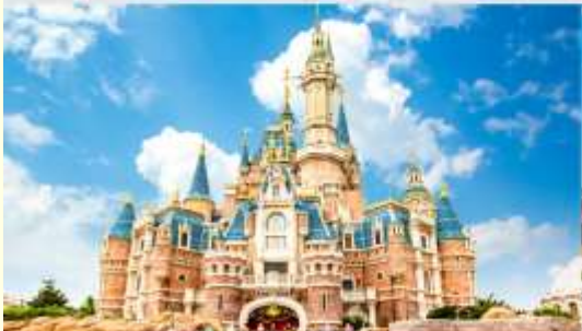
ดิสนีย์แลนด์