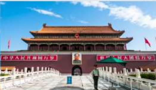
จัตุรัสเทียนอันเหมิน