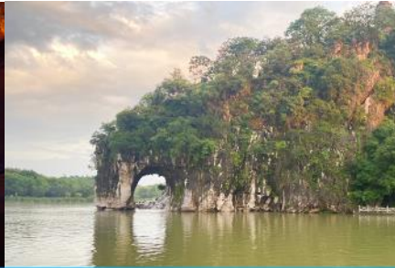
เขาวงช้าง