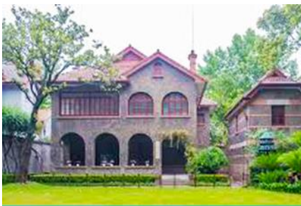
บ้านเกิดซุนยัตเซน

พักที่ IRVINE HOLIDAY HTL OR HUICHANG HTL 3* หรือ โรงแรมในระดับเดียวกันในเมืองจูไห่