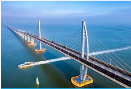
สะพาน อ่าวกง จู่ไห่ มาเก๊า

พักที่ IRVINE HOLIDAY HTL OR HUICHANG HTL 3* หรือโรงแรมในระดับเดียวกันในเมืองจู่ไห่