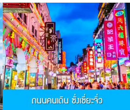
ถนนคนเดิน ชังเซี่ยจิว