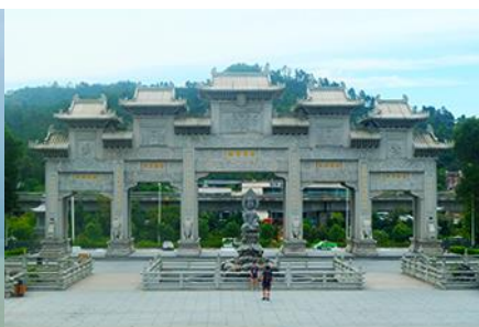
วัดฟูโกวซื่อ