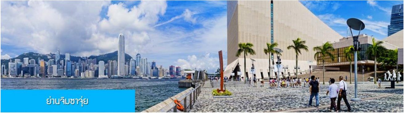
ย่านจิมซาจุ่ย