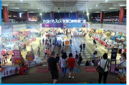
ตลาดใต้ดินกงเป๋ย