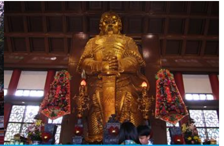
วัดเขกวงเมียว