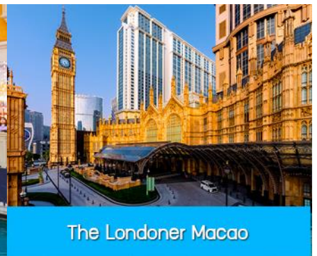
The Londoner Macao