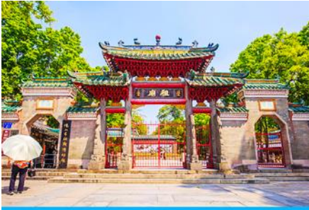
วัดจูเมี่ยว