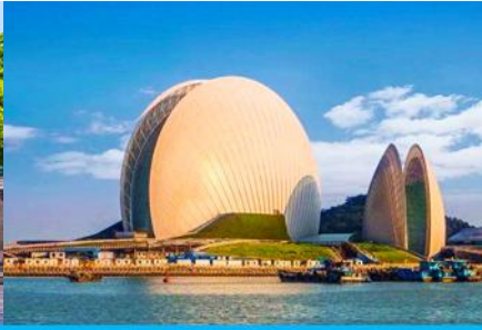
โรงละครจูไห่