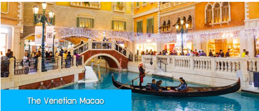
The Venetian Macao

จากนั้นนำท่านผ่านด่านกักเปย์เพื่อเดินทางสู่ เมืองมาเก๊า 澳門 เขตปกครองพิเศษที่อยู่ใต้สุดของจีน ที่ได้ชื่อว่า ลาสเวกัสของเอเชีย แหล่งรวมสถานบันเทิง คาสิโน โรงแรม รีสอร์ท และร้านจำหน่ายสินค้าแบรนด์เนมชั้นนำจากทั่วโลก อีกทั้งยังเป็นเมืองท่องเที่ยวยอดนิยมที่นักท่องเที่ยวทั่วโลกเดินทางมาเยือนปีละ 30 ล้านคน.. ข้ามสู่เมืองมาเก๊า