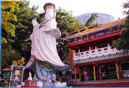
อ่าว Repulse Bay