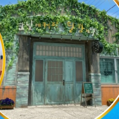
ตามรอยซีรีส์ดัง Hometown chachacha

โพลังสเปซวอล์ค สกายวอร์ค ตามรอยซีรีส์ Hometown chachacha ถ่ายรูปชิคๆ หมู่บ้านวัฒนธรรมคิมซอน ขึ้นเคเบิลคาร์ ชมทะเลปูซาน นั่งรถไฟปูคปิก sky capsule ซิมของอร่อยตลาดแฮนแด อิสระช้อปปิ้ง Lotte Duty Free