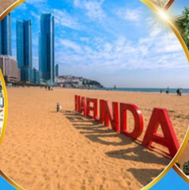
หาดแฮนแด