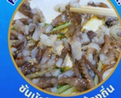
ชั้นนักชี อาหารท้องถิ่น