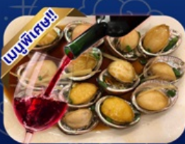
ชิฟุโด เป้าอื้อโฮบิตแดง