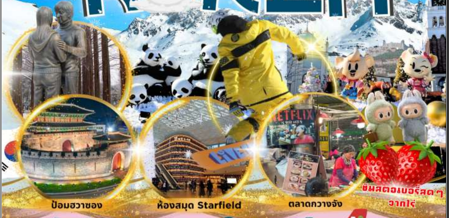
ป้อมฮวาซอง