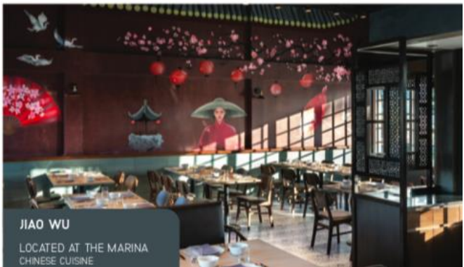
JIAO WU LOCATED AT THE MARINA CHINESE CUISINE