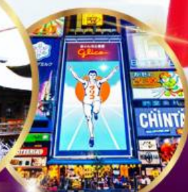
ช้อปปิ้ง ซินโซบาชิ