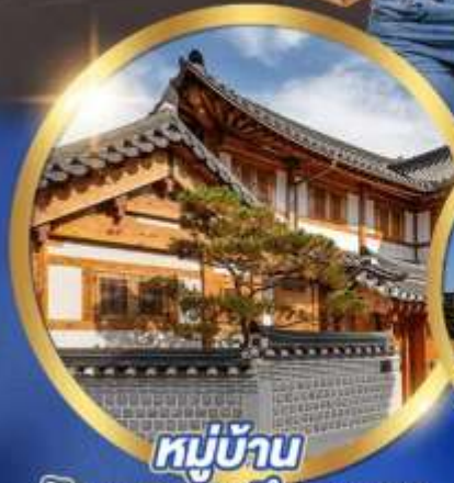
หมู่บ้าน วัฒนธรรมอินพยอง