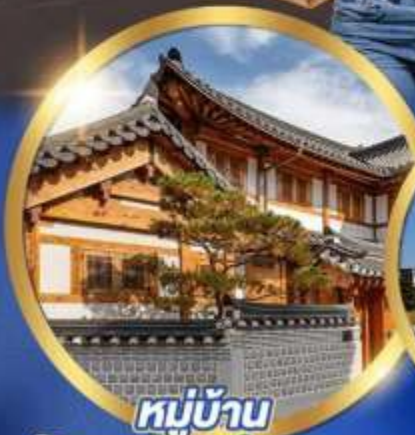
หมู่บ้าน วัดนธรรมอินพยอง