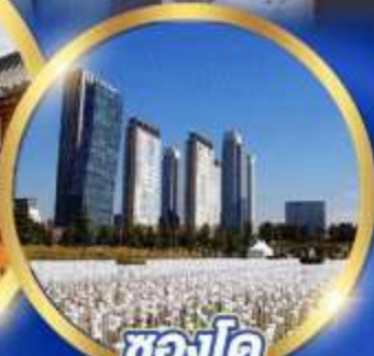
ชองโด Central park