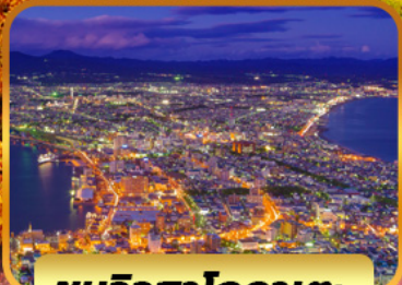
ชมวิวดาโกดาเตะ