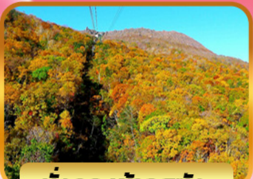
นั่งกระเช้าอุซุซัง