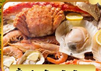
บั้งย่างร้านดังน้บดะ