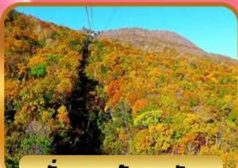
นั้งกระเช้าอุสุซัง