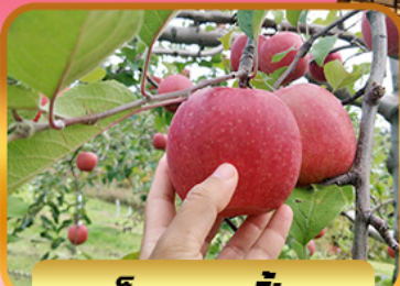
เก็บแอปเปิ้ล