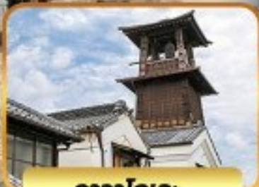
คาวาโกเอะ