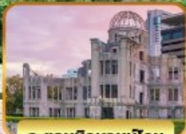
อะตอมบิคมอบบิโดม