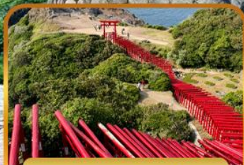
ศาลเจ้าโมโตโนสุมิอินาริ