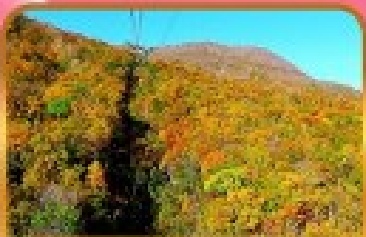
นั่งกระเช้าจุสุซัง