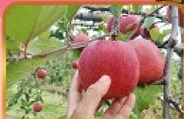
เก็บแอมเปิ้ล