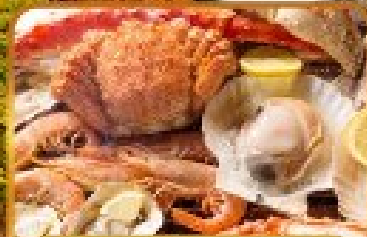
บิงย่างร้านดังเน้นตะ