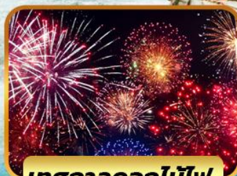
เทศกาลดอกไม้ไฟ