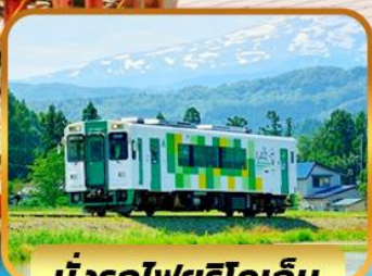
นั่งรถไฟยูริโคเกิน