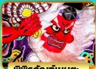
หน้ากากยักษ์ที่เนบูตะ