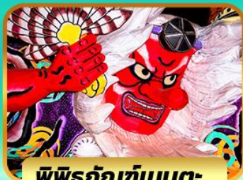
พิธีรำนทท์เมบูตะ