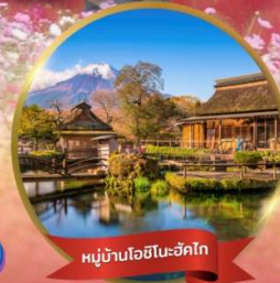
หมู่บ้านโอชิโนะอักษิโก