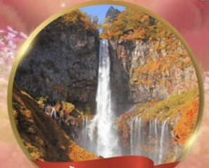
น้ำตกเคคอน