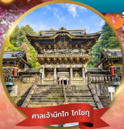
ศาลเจ้านิกโก โทโชกุ

• บุฟเฟ่ต์ชาบู • บุฟเฟ่ต์บิงชังยา • ชาบูบุฟเฟ่ต์