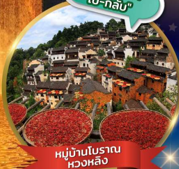
หมู่บ้านโบราณ หวงหลิง