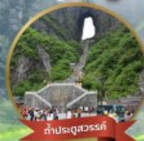
กำแพงระดู