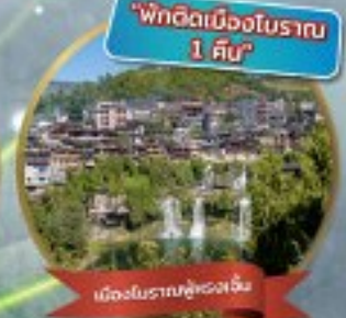
"พักติดเมืองโบราณ 1 คืน"