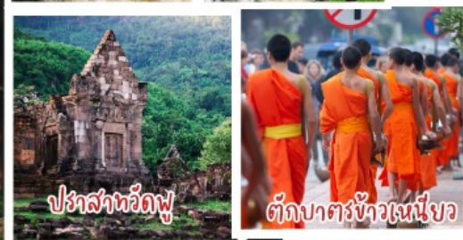
ปราสาทวัดพู