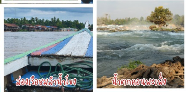
ล่องเรือชมลำน้ใ้โขง