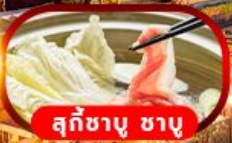
สุกี้ชาบู ชาบู

พักโรงแรม 5 ดาว แช่น้ำแร่ร้อนเซ็นส่วนตัว