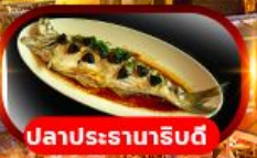
ปลาประรามาริบดี