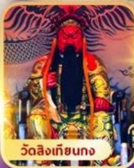
วัดลิงเกียกง