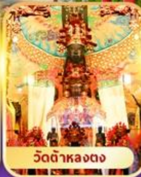
วัดต้าหลงตง