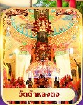
วัดต้าหลงตง