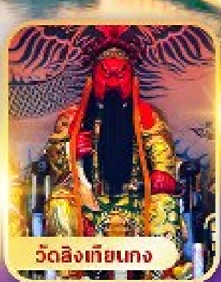
วัดสิงเกียนทง