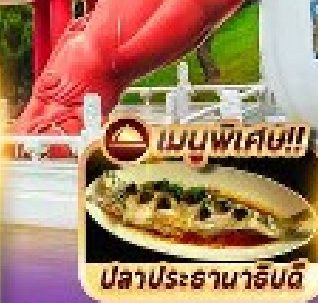
เมนูพิเศษ!! ปลาประธนาจีนดี