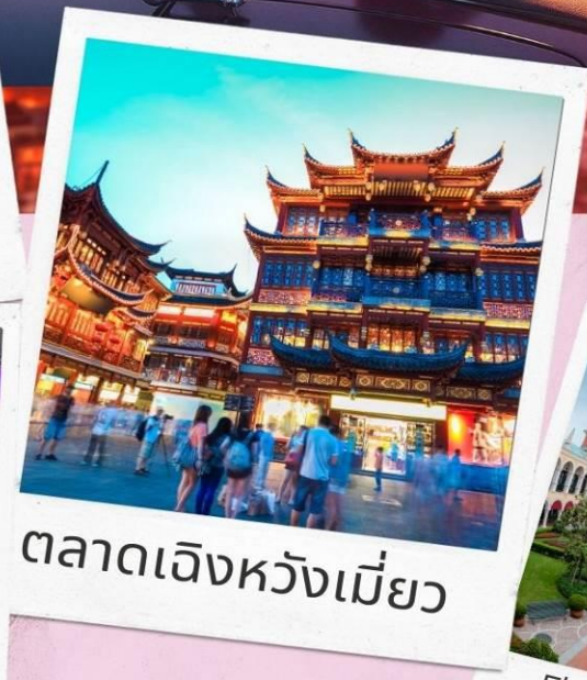
ตลาดเจิ้งหวังเมี่ยว