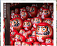
วัดคังสึโอจิ