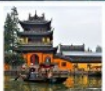
หมู่บ้านโบราณซูเจียเจียว