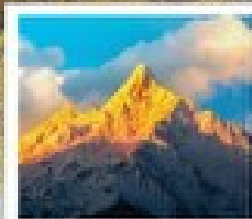
ภูเขาคิมะเท่ม่งซี