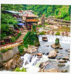
หมู่บ้านก๊อตกัต