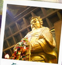
วัดเขาหงษ์มิว