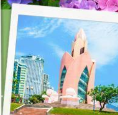
อาคารตอกบัว