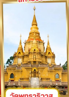
วัดพุทธาธิวาส