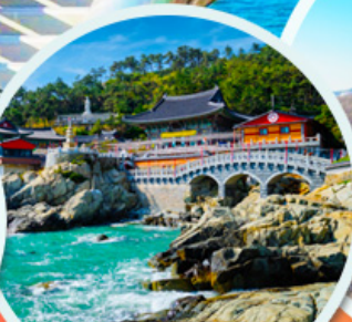
วัดแฮดง ยังกุงซา