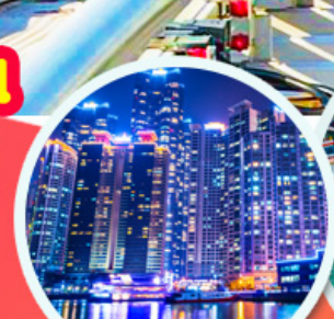
The Bay 101