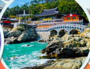
วัดแฮดง ยงกุงซา