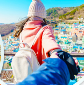
หมู่บ้านคัมซอน