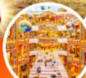
ห้องสมุดสตาร์ฟิชต์

• พิเศษ!! โซลฟอเรสต์เดินวัง + ถนนสายโรแมนติกที่อกซุกุง