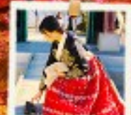
โซลฟอเรสต์