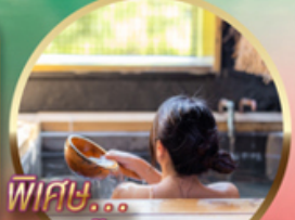
พิเศษ... อาบน้ำแร่ แช่ออนเซ็น!