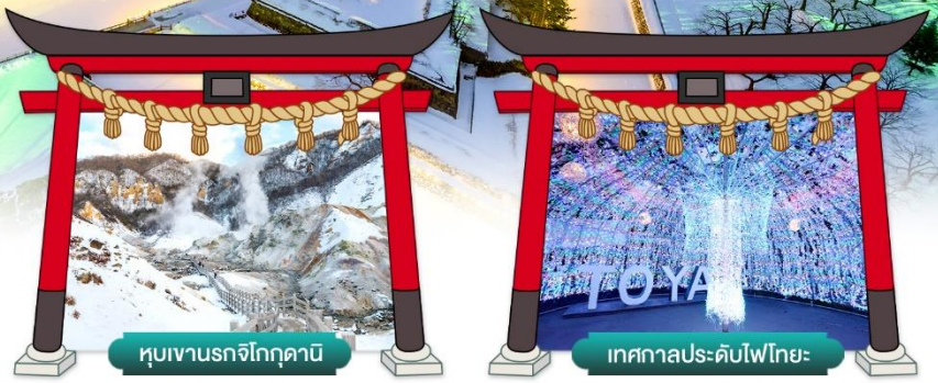
หุบเขานรกจิกุกุตามิ